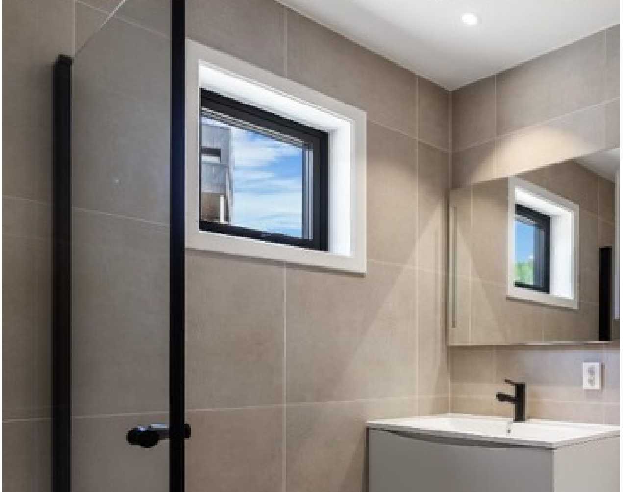
Illustrasjonsbilde av bad med moderne flisformat og stilrent sanitæruttrykk.